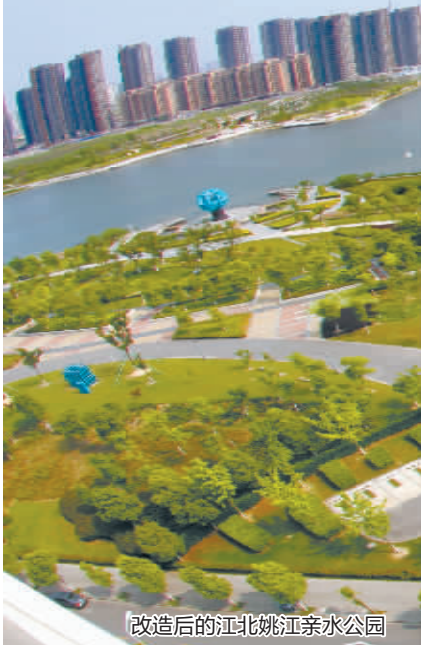
改造后的江北姚江亲水公园