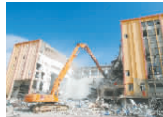
江北区孔浦街道拆除了原海洋渔业公司地块内1000平方米的违法建筑，打响了宁波拆除“违建王”的响亮一枪。