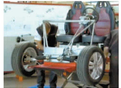
用户按图纸组装汽车。(视频截图)

想买车时你会怎么做?绝大部分人的答案会是:去4S店。这种状况也许在不久的将来会发生改变:意大利“开源汽车”公司生产出一种可以自行组装的汽车,用户把汽车零件买回家去,网上下载好图纸,不用一个小时就能组装出一辆个性汽车。