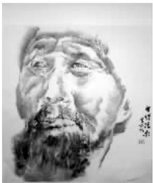
“邵秉坤水墨人物肖像画回乡汇报展”作品。

邵秉坤1938年出生在宁波慈城,1964年毕业于中央工艺美术学院(现清华大学美术学院),师从吴冠中、张仃、庞薰琹、姜士白、袁运甫等大家,几十年来勤奋探索自己的水墨山水画等,并以格调清新、律动有致、墨韵浓醇、雅俗共赏形成自己独特的艺术风格和语境。 商文