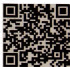
IPHONE手机下载 Andriod手机下载