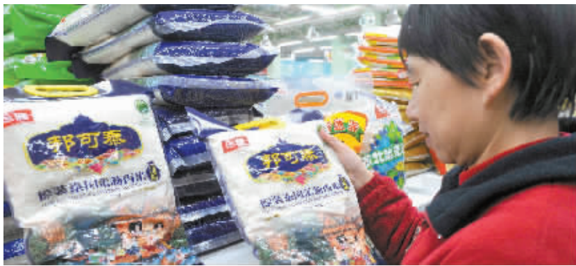
市民在一家超市选购进口大米。

检验检疫专家分析认为，随着中国居民消费水平的提高，进口大米越来越受欢迎，预计2014年中国大米进口量或将突破300万吨，将成为世界最大的大米进口国。