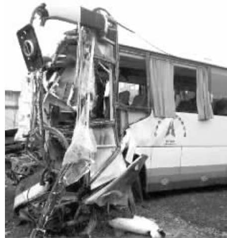
事故客车被撞得面目全非。

昨天凌晨1时17分许，一辆宁海客车在杭甬高速绍兴段往上海方向发生车祸。高速交警随后发布的消息称：车祸造成2人死亡、12人受伤。