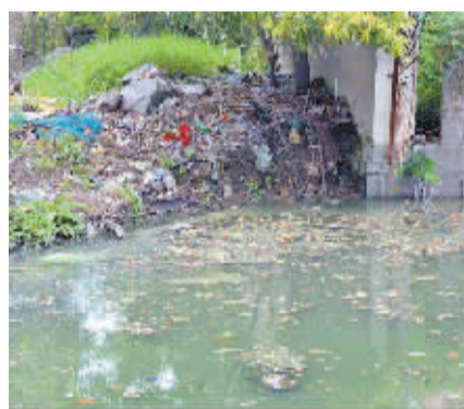
春城花园旁的小河漂浮杂物臭气扑鼻。