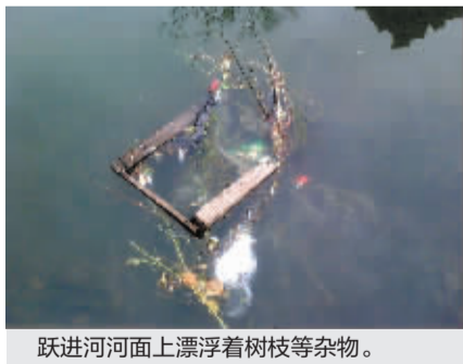
跃进河河面上漂浮着树枝等杂物。