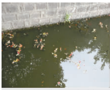
福明家园咸隘河淤泥堆积导致河水发黑。