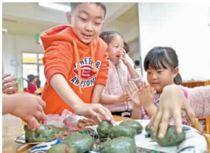
江东实验幼儿园的小朋友在做青团。

虽说要“临水袈裟”,可既然出来了,自然要欣赏一下大好春光,踏青的习俗便由此而来,并沿传至今。