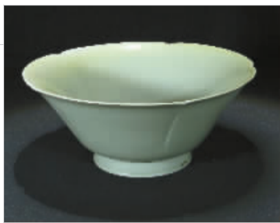
复制唐代秘色葵口碗