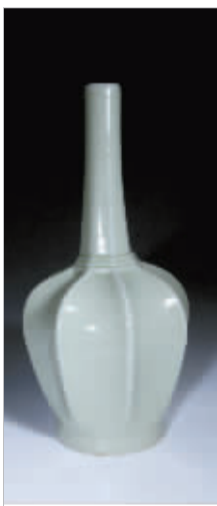
越窑秘色瓷八棱瓶