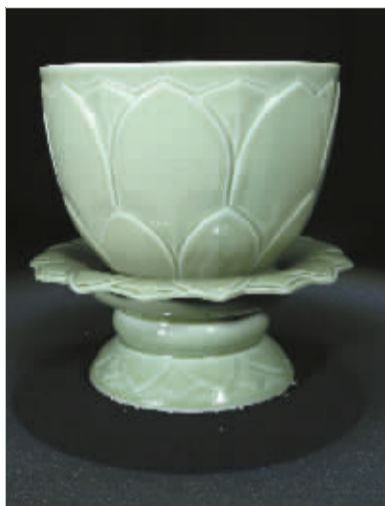
复制五代越窑秘色瓷莲纹盖托