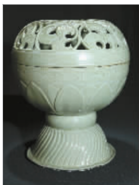
越窑秘色瓷瓣缕孔卷叶缠枝纹香薰