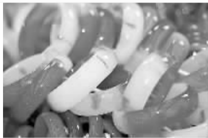
市面上的染色玛瑙很多。