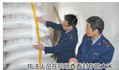
执法人员现场检查封存的大米。

大米过期是在哪个环节发生的问题?“调查中我们发现,20多家米面加工厂使用的都是老式机器,只有1家更新换代了机器。按照米面传统制作的方法,老机器和传统工艺使用陈米不会产生粘性的效果,制作的产品口感相对较好,市场销路