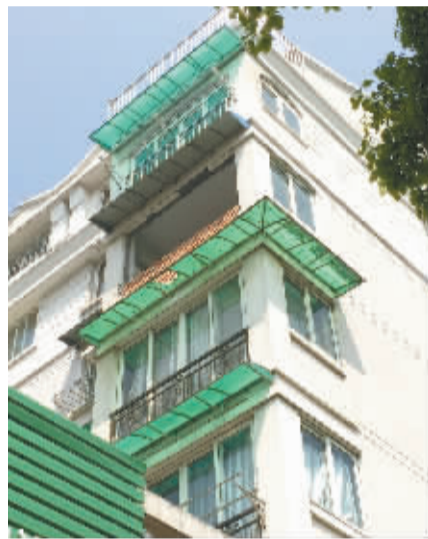
联丰世纪苑70号501住户已经将阳台外立面全部拆除。

昨日,有市民向本报新闻热线投诉,海曙区白云街道联丰世纪苑有住户野蛮装修,破坏了两堵承重墙,楼下楼下的住户都很担心。