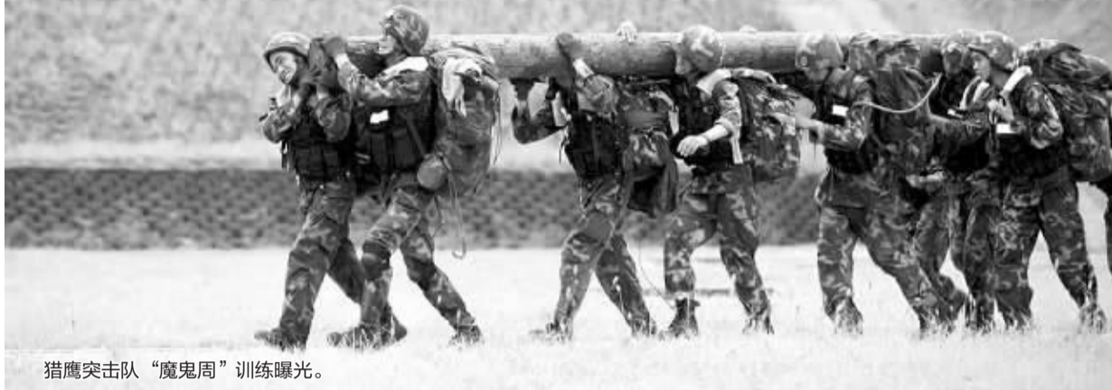
猎鹰突击队“魔鬼周”训练曝光。

4月9日，中共中央总书记、国家主席、中央军委主席习近平视察了中国人民武装警察部队特种警察学院，并为“猎鹰突击队”授旗，使得这支国家级反恐拳头部队引起人们瞩目。