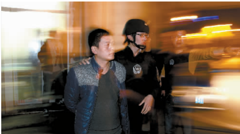
3月25日晚,“2·20专案”的抓捕及审讯现场。案件详情请看13版特别报道。

据市公安局消息,今年第一季度,全市各级公安机关突出打击主线,创新打击战法,深入打击人民群众反映强烈的严重暴力刑事犯罪和侵财型犯罪,共破获刑事案件4385起,刑拘犯罪嫌疑人3516名,破获10起以上系列性侵财犯罪案件24串,打掉6人以上侵财犯罪团伙12个,打掉涉恶团伙8个,有效地挤压了犯罪空间,维护了社会治安稳定。