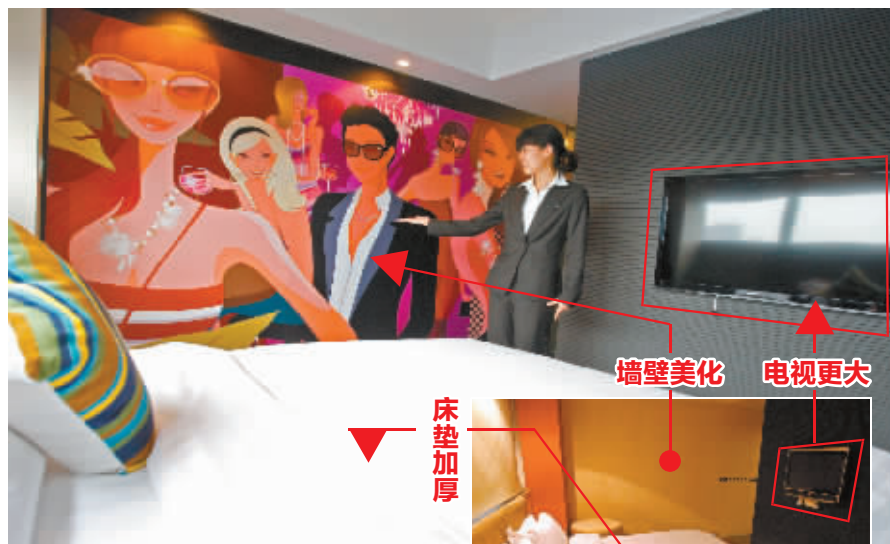
南苑e家客房设施升级前后对比。