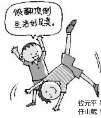
钱元平 辑录 任山薇 配图