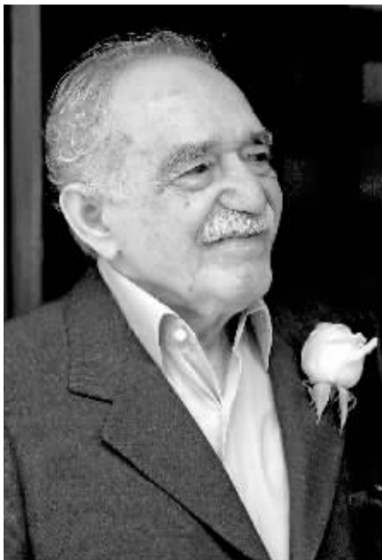
加夫列尔·加西亚·马尔克斯