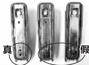
正品：五金底无工艺压痕