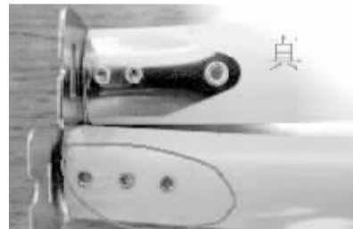
假冒产品没有尺钩衬片