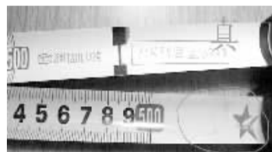
假冒产品尺带尾部没有编号