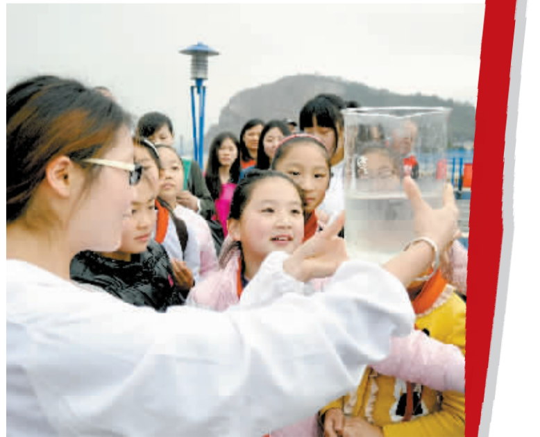
青少年参观自来水厂。