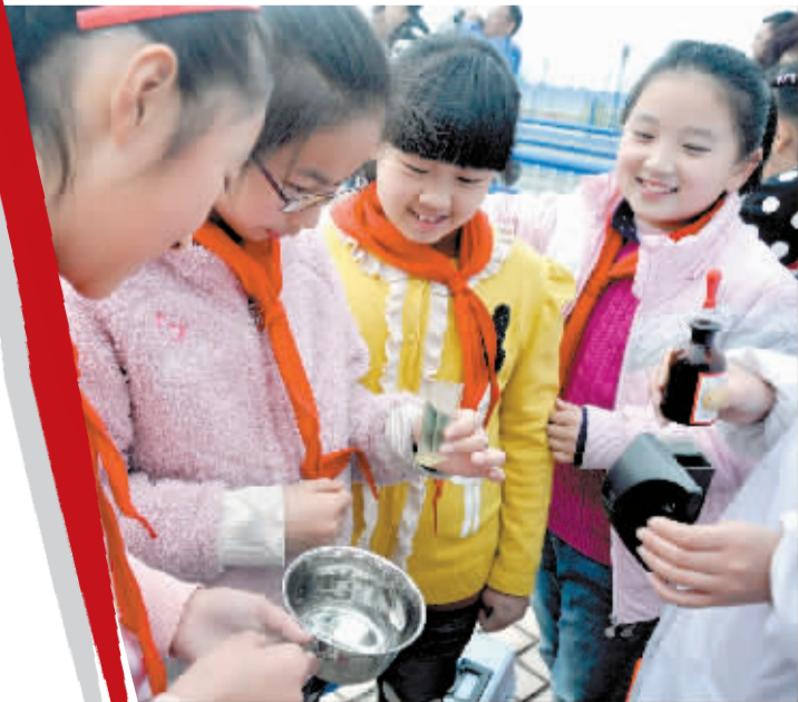
青少年做水质实验。