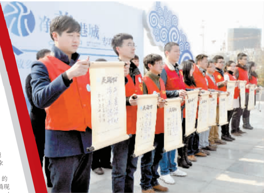
广发“青春治水”英雄帖。