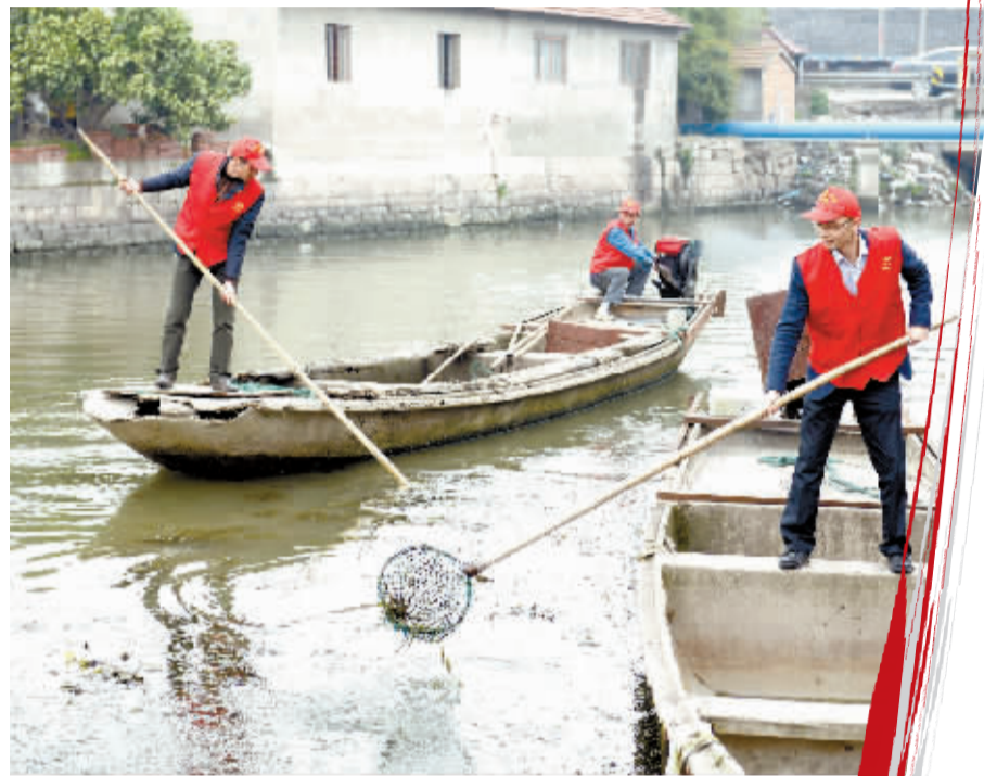
清水绿岸保护母亲河志愿服务在行动。