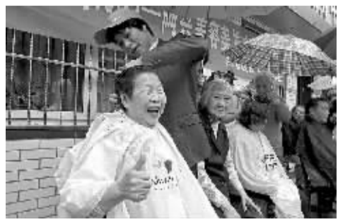
阿兴美发店理发师们为社区老人免费理发。

商报讯(记者 周雁 通讯员 潘蕾)5月11日母亲节当天,阿兴美容美发店的全体员工展开了向社会奉献爱心的活动,为困难老人和儿童提供免费理发服务,据悉这也是海曙区民营个体协会向全区非公有制经济人士发出了“光彩慈善行”倡议后的第一站活动。