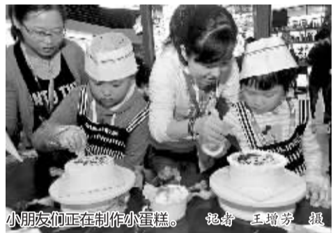
小朋友正在制作小蛋糕。