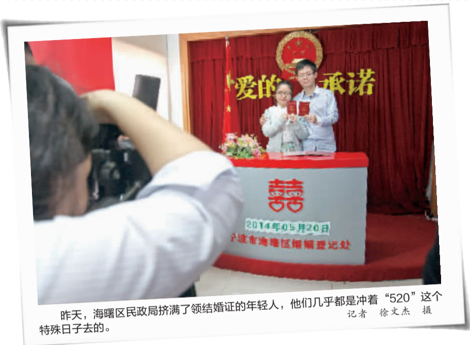
昨天,海曙区民政局挤满了领结婚证的年轻人,他们几乎都是冲着“520”这个特殊日子去的。