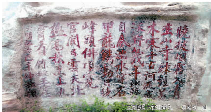
王阳明《大伾山诗》。

米,宽近10米,青石砌筑,气势不凡。裴顺昌说:“这是古代浚县卫河上唯一的桥梁,见证了运河的兴衰变迁,至今还是进出浚县古城的主要通道。”