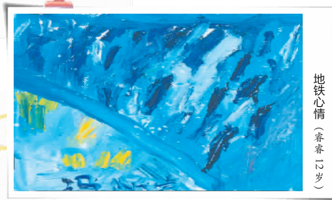
地铁心情 (睿睿 12岁)