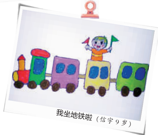
我坐地铁啦 (信宇 9岁)