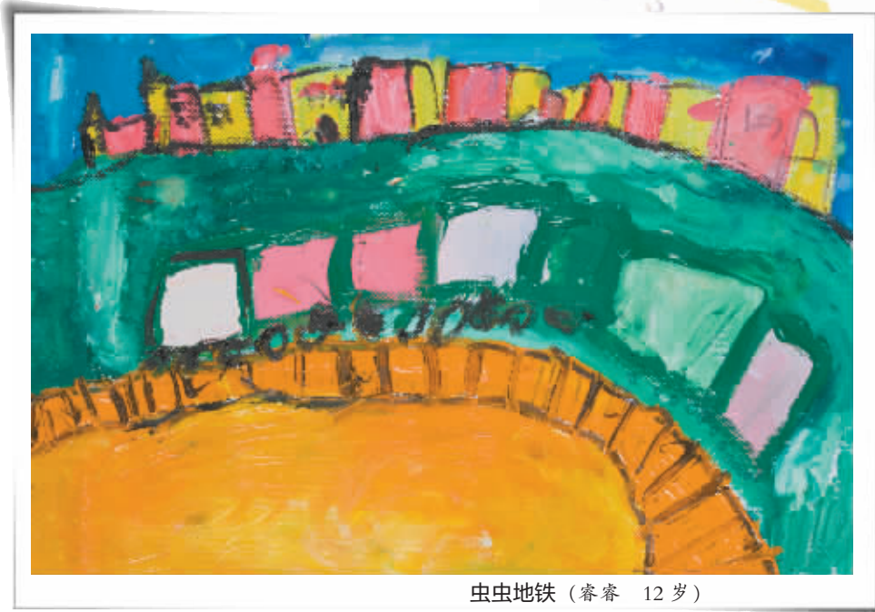
虫虫地铁 (睿睿 12岁)