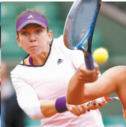
如今缩胸后，哈勒普迎来了事业上的巅峰。