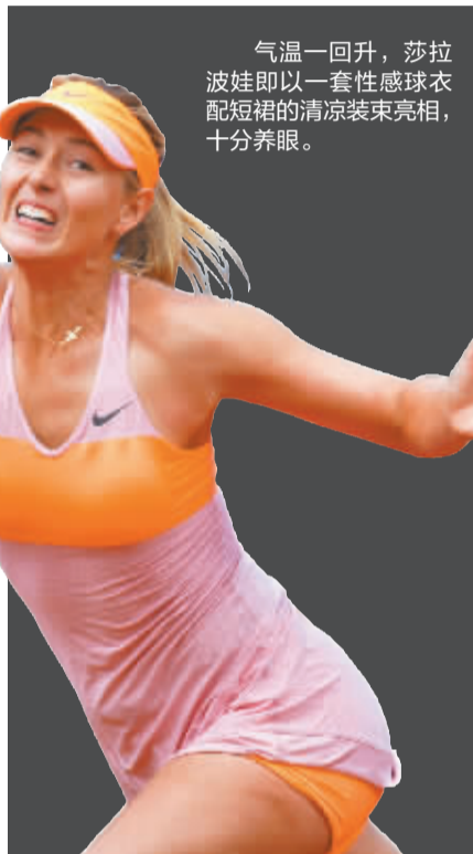
气温一回升，莎拉波娃即以一套性感球服配短裙的清凉装束亮相，十分养眼。