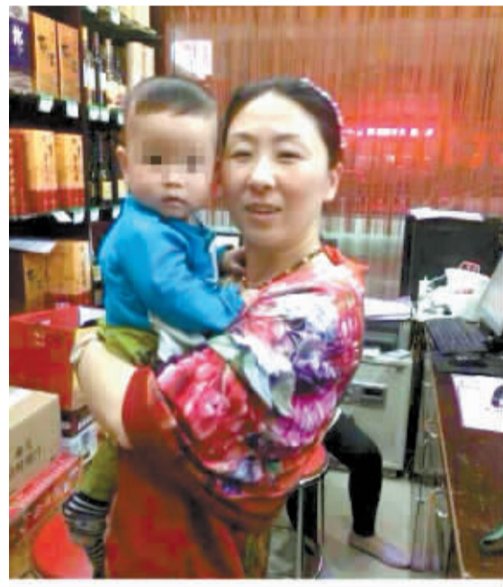
网友发布的孩子和家长合影。