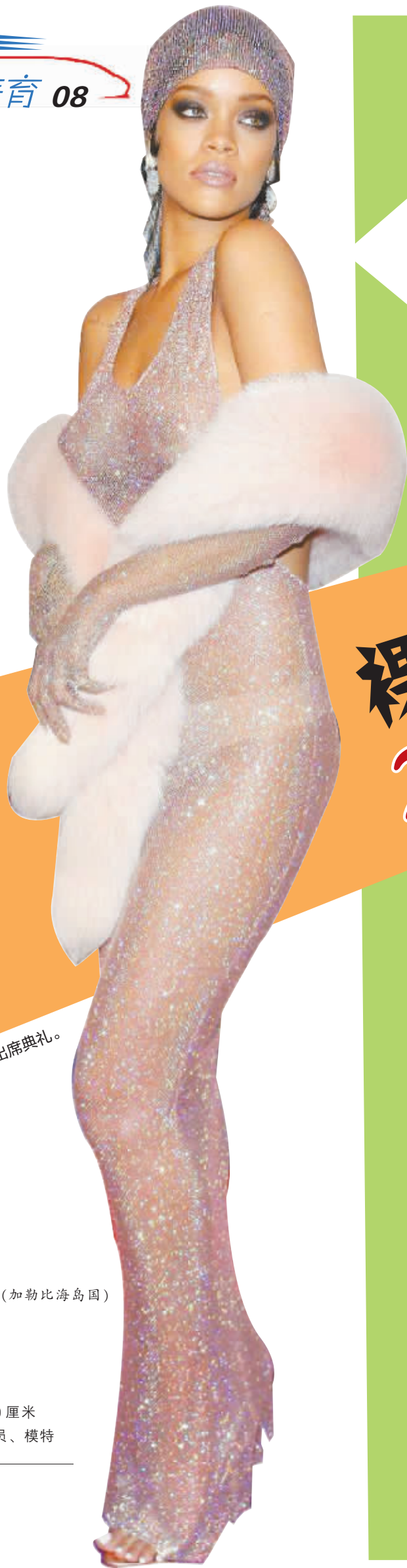
蕾哈娜身着水晶礼服出席典礼。