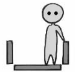
自动扶梯靠右侧站立