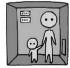
儿童乘梯时应由成人携带