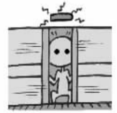
车门关闭时切勿强行上下车

宁波地铁一号线正式投入运行已经一周了。记者从市公安局轨道交通治安分局了解到,目前,地铁治安情况良好,没有出现大的警情,更多还是以乘客咨询、求助的服务性工作为主。