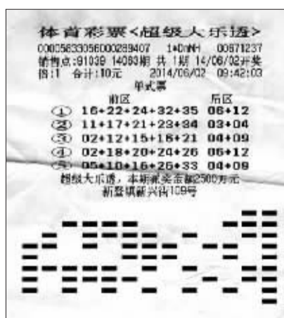
这张机选彩票中了1500万元

现得很淡定, 他开玩笑地说: “其实对于我自己而言, 买彩票就是买一个希望。如果真的中了, 就是‘单车变摩托’啊, 哈哈。”