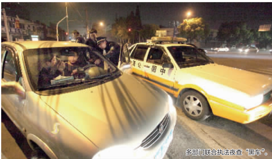
多部门联合执法夜查“黑车”。