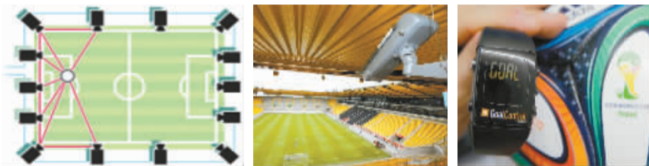
球门监控公司在球门附近安装了7台鹰眼摄像机，利用门线技术跟踪足球轨迹。