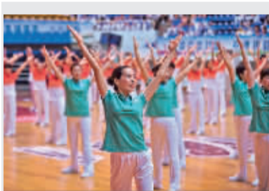
昨天,宁波市第九届职工运动会广播操比赛在雅戈尔体育馆举行,来自全市26支代表队的千余名运动员参加。最终镇海区队、海曙区队、市教育系统队,分获前三名。

亚锦赛中,中国队半决赛2:3负于泰国队,最终名列第四。 在今年的新赛季开始之后,以锻炼队伍为目标的中国女排在瑞士女排精英赛上获得第四名。随后,中国队又回国进行了一段时间的训练,备战国际女排精英赛。 目前,中国女排已经抵达北仑。郎平更新自己的微博说:“瑞士精英赛后经过20天的训练,我们又迎来了北仑、郴州两站四国女排邀请赛。我们会全力认真打好每场球,学习各队的优点,达到交流提高的目的。”