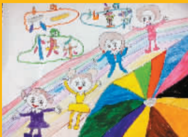
江北中城小学 201 班 快乐六一 指导老师:杨红 陈珂宁