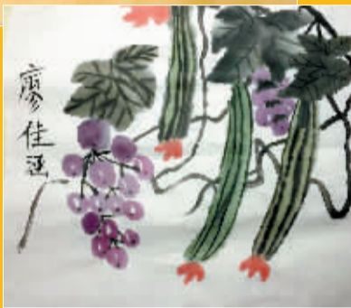
宁波东海实验学校 203 班 廖佳涵 指导老师:王裕军