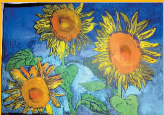
江东南安小学 304 班 向日葵 胡诗雨