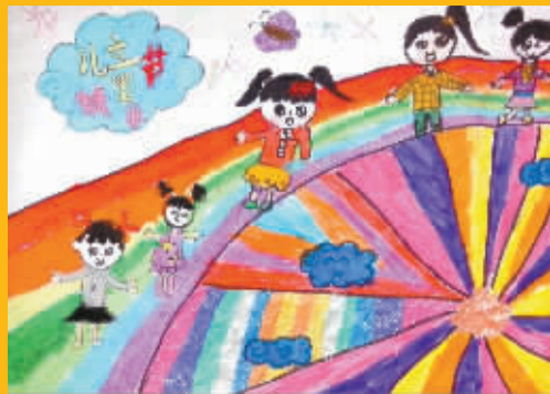
指导老师:杨红 江北中城小学 201 班 六一儿童节 应羽梦