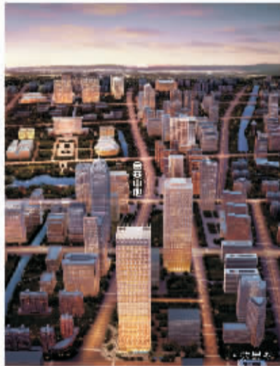
高写字楼——品质、物管、服务

2013年,全球五大行之一高力物管首献宁波,落户金安中心,不仅为入驻宁波名企提供优质的世界级物业服务,更为写字楼未来发展保驾护航。