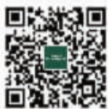
微信扫一扫 家居资讯早知道

制作家具不仅是一门艺术，将独特的技艺一代又一代完好的传承下去也是一门艺术，正因如此，从1898年CHELINI开始生产家具以来始终完美地保持着这些艺术价值。CHELINI的每一件产品都是由技艺娴熟的工艺大师，秉承每一道古老且完美的工序标准，追求细节，讲究装饰，使得每一件亚振家具产品均凸显欧式古典的优雅和极具艺术灵魂。