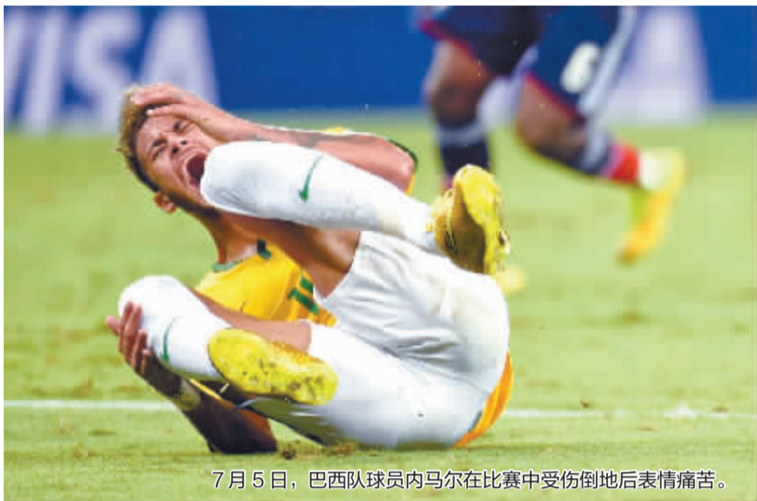
7月5日，巴西队球员内马尔在比赛中受伤倒地后表情痛苦。