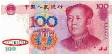
图中红圈标记处即为人民币冠字号。

行 ATM 机旁，取款时发现能看到“打印冠字号”的功能选择键。一按这一功能键，机子就吐出一张“自动柜员机客户通知书”，上面注明了取款的时间、机具号、交易序号以及款项的冠字号。该行的 ATM 机也有“打印凭条”功能。