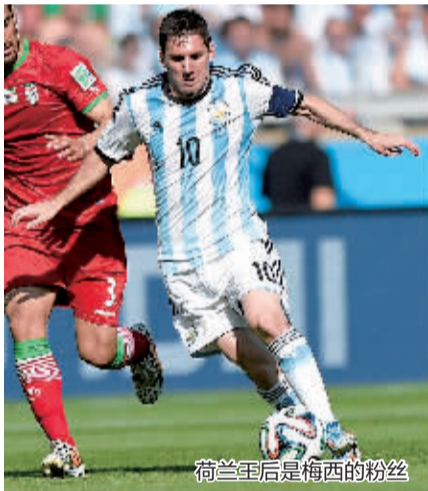
荷兰王后是梅西的粉丝

很遗憾,如此暖心的场面,将不会出现在10日半决赛上了。荷兰的下一个对手,是同为足球强国的阿根廷。而马克西玛是一个地地道道的阿根廷人。在很早之前,马克西玛就曾宣布,自己是梅西的球迷。如今在面对娘家与婆家的比赛时,马克西玛或许将会支持阿根廷队,而本场比赛也将罕见地上演“王与后的战争”。