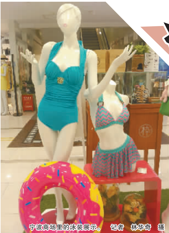
宁波商场里的泳装展示。

当总编布置了“比基尼”这个作业后,小D脑海漂过的是“性感、美女、沙滩、躺椅”等画面。看起来,这是一个跟夜宵报道一样美的差事。可后来,小D发现,一个男记者采访“比基尼”,有些不方便!身边敢秀比基尼的女同事和朋友少之又少,打听她们衣柜里有没有比基尼,得到的答案却是:“没有啦、变态、小心告你骚扰、你这要闹哪样啊?”