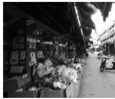
城隍庙外围东侧的一排商铺仍在营业。