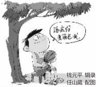
钱元平 辑录 任山葳 配图