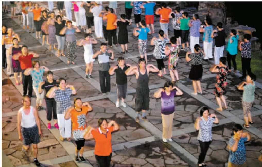
越来越多的中老年人加入到跳广场舞的行列。图为众多市民在中山广场跳广场舞。