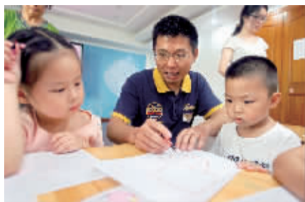
活动现场。

王老师介绍道:“人脑就像一个沉睡的巨人,人类平均只用了不到1%的大脑潜力,而一个正常的大脑记忆容量有大约6亿本书的知识总量,相当于一部大型电脑储存量的120万倍。如果我们能掌握正确的记忆方法,记东西完全不是问题。”之后,王老师又向大家传授了三个记忆小窍门,分别是谐音记忆法、联想记忆法、协同记忆法。