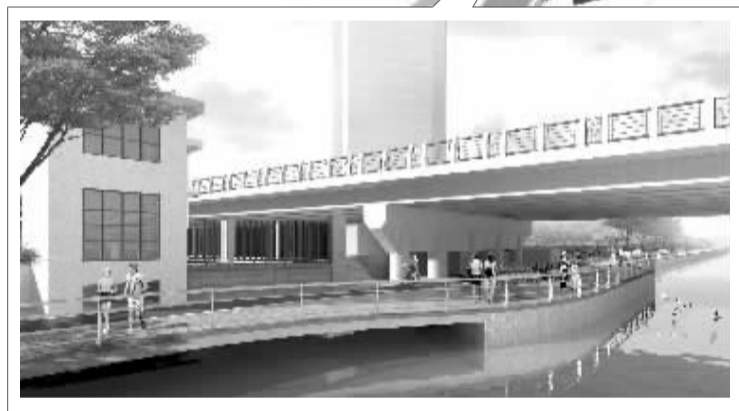
兴宁桥桥底效果图。