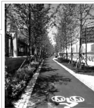
奉化江畔的自行车道。