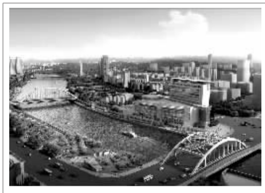
灵桥和琴桥效果图