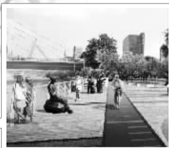
甬江桥边的雕塑像