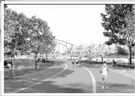
琴桥边的休闲场地效果图