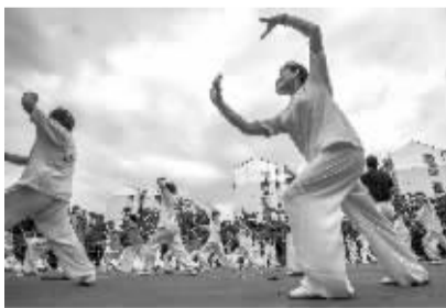
昨天, 白云街道居民们在华天小学操场展示百人太极拳。

体活动场所。目前, 广济中心小学、华天小学、十五中学等学校的操场在晚上已对居民开放; 像牡丹社区也争取到辖区共建单位社区学院和招商银行的空地给居民锻炼。