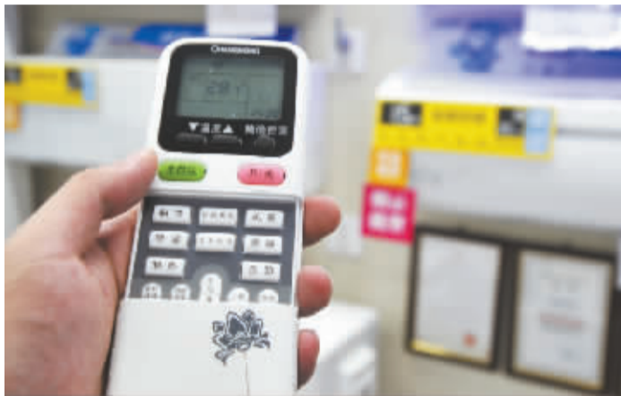
海曙一家家电卖场,营业员告诉记者,老人们喜欢遥控器字大点,功能方便点的空调。

酷暑天气,一台空调带来清凉。对于老年人来说应该选择怎样的空调?怎么根据房间的面积来选择空调?吹空调要注意哪些问题?昨天,记者来到苏宁电器售后服务中心,针对老年消费者使用空调遇到的问题,请专家来支招。 记者 孙美星