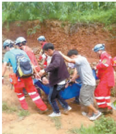
四明户外救援队队员与当地居民用折叠担架转移行动不便的老人。