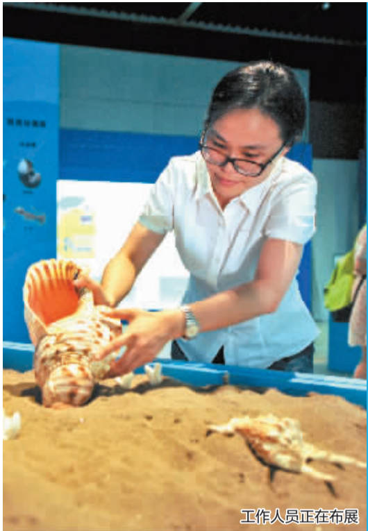
工作人员正在布展