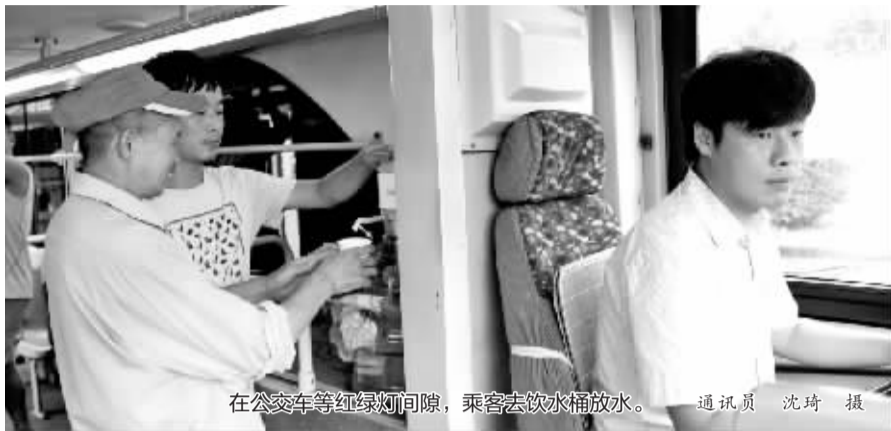
在公交车等红绿灯间隙, 乘客去饮水机放水。