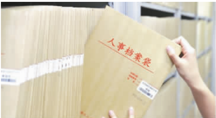
编辑：朱锦华 褚笑寒 美编：包震伟 2014年8月20日 星期三

李女士介绍，对于70年代出生的人来说，1974年以前出生的还赶上分配工作的时候，她所认识的一位曾在云南汽车厂工作的师兄正是1974年出生的人，这位师兄一直清楚自己的档案所踪，而其后的入大部分犹如李女士一般对自己的档案去向模糊不清。