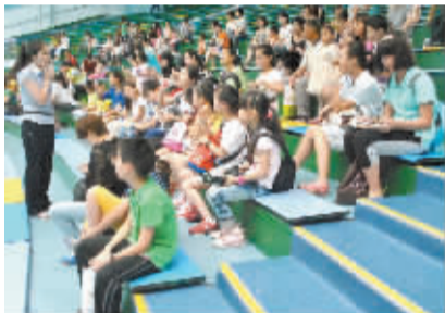
小记者与海洋生物亲密接触。