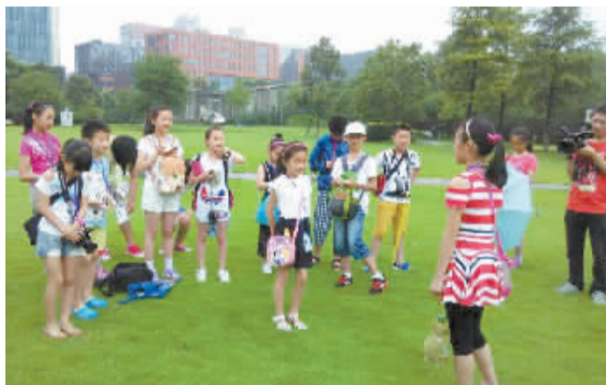
小记者进行户外采访现场写作。