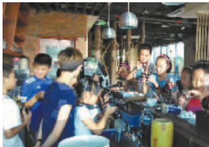
小记者了解咖啡文化和知识。